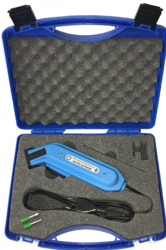
CWT Electro Cauterizer in beschermende draagkoffer

De CWT Electro Cauterizer is een cauteriseer apparaat ten behoeve van veterinaire medische toepassingen.