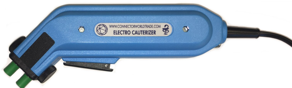
CWT Electro Cauterizer Art. nr: 26.1.300

De CWT Electro Cauterizer is een cauteriseer apparaat ten behoeve van veterinaire medische toepassingen.